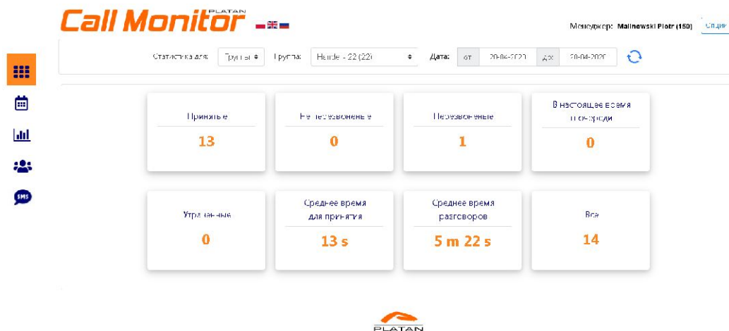
Platan Call Monitor, отображение для Менеджера на статистику текущих звонков